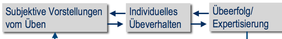
Abbildung 1: Wirkzusammenhänge zwischen subjektiven Vorstellungen vom Üben, Übeverhalten und Übeerfolg

Auf dem Gebiet der Lernforschung ist nicht nur der Zusammenhang zwischen globaler Lernorientierung und den angewendeten Strategien bekannt, sondern auch ihr Effekt auf die Lernergebnisse gezeigt worden (Marton/Säljö 1976a, 1976b). Auf der Grundlage der Ergebnisse von Cantwell und Millard (1994) kann vermutet werden, dass die zwei globalen Lernorientierungen mit den gewählten Übestrategien beim Erlernen eines neuen Musikstückes korrelieren. Hallam (1995b) geht in ihrer Studie noch einen Schritt weiter und formuliert in Anlehnung an Sloboda (1985) globale Orientierungen des Übens. Die 22 zu ihrem Übeverhalten beim Erlernen und Interpretieren eines neuen Stückes befragten professionellen Musiker/innen werden gemäß ihrer Interviewaussagen in die drei Kategorien einer ausschließlich technischen, einer ausschließlich musikalischen und einer beide Aspekte umfassenden Orientierung eingeordnet (Hallam 1995b). Bei einer musikalischen Orientierung zeigt sich im Interview, dass beim Üben die Analyse von Musik und die Aneignung von musikalischem Wissen statt das Erlernen von Technik im Vordergrund stehen. Eine technische Orientierung zeichnet sich durch die Betonung des Übens von Etüden und von technischen Aspekten aus. Bezeichnenderweise wurde auch in dieser Untersuchung ein struktureller Zusammenhang zwischen den erhobenen Übestrategien und den soeben beschriebenen globalen Orientierungen des Übens gefunden.