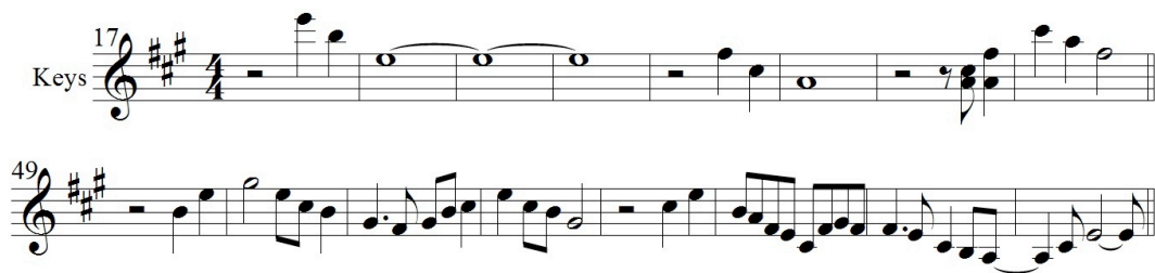
Abbildung 1: Pianomelodie des Formteils I (Takte 17-24 und 49-56; ab 1:02 min. und 2:12 min.)

Die Melodie basiert überwiegend auf viertaktig organisierter Dreiklangsmelodik bzw. Akkordbrechungen (z.T. werden aber durch Umkehrungen große Sprünge erzeugt) mit vereinzelt dreiklangsfremden Durchgangstönen. Sie wird durch sukzessive Ausdehnung des verwendeten diatonischen Skalenmaterials von fis-Moll mit großem Ambitus (zwei Oktaven + große Septime) sowie Diminution der Notenwerte und zunehmende rhythmische Dichte intensiviert und zu einer Klimax (Strophe 1) geführt (siehe Abbildung 1).