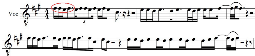
Abbildung 3: Beginn der Gesangsmelodik der Strophe 1 (Wechselnotenmotiv markiert; 2:29 min.)

der Uhren oder der 120 bpm schnelle Pulsschlag des Intros rhythmisch imitiert (siehe Abbildung 3).